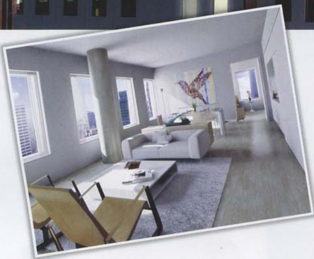
QUI SOPRA: un modello di appartamento del Cassa, l'albergo-condominio progetto di Enrique Norten che sorgerà nella zona di Midtown Manhattan. IN ALTO: un rendering dello skyline di Manhattan con il Cassa in primo piano. SOTTO: un ambiente dell'Hotel Murano a Tacoma.